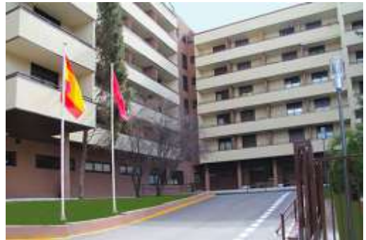
Residencia Casasolar RAHE

who are among the most scholars of all Spain; the “Residencia de mayores CASASOLAR” https://www.hidalgosdeespana.es/centros/residencia-casasolar/ which hosts elderly people in Madrid who can lead a life similar to those that led to their family; the “RESIDENCIA CASAQUINTA”